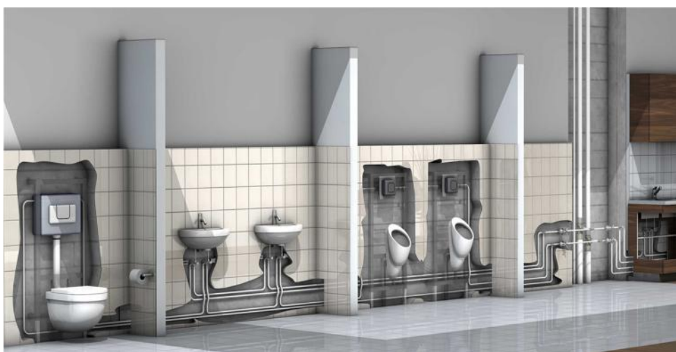
Esquema de instalación de fontanería en loop

Las instalaciones de fontanería tipo “Loop”, minimizan los riesgos de estancamiento de agua y la posibilidad de aparición de bacterias, como la legionella, de manera más efectiva que las instalaciones tradicionales (colectores o Tés) donde puede haber riesgo de estancamiento, en caso de que un aparato no sea utilizado durante un largo periodo de tiempo.